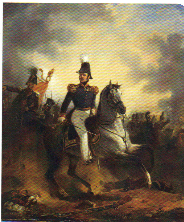
Luitenant-generaal Frederik Knotzer in de slag bij Houthalen, gedurende de Tiendaagse Veldtocht, 1831 (Nicolaas Pieneman, 1834, olieverf op doek, Schilderijencollectie Rijksmuseum Amsterdam)

Op voorhand kan gezegd worden dat de militaire en fiscale onlusten in Noord-Nederland evenals de fiscale en hongeronrust in Vlaanderen en Wallonië als opmaat naar de scheiding