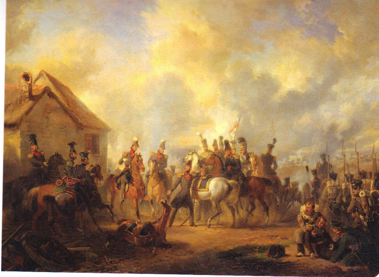
De slag bij Boutersem, 12 augustus 1831, gedurende de Tiendaagse Veldtocht (Nicolaas Pieneman, 1833, olieverf op doek, Schilderijencollectie Rijksmuseum Amsterdam)

van iets minder grote katholieke meerderheden in de dorpen en steden aldaar. Maar evenals in Twente is er in de Achterhoek ten tijde van de Belgische Revolutie nogal wat dienstweigering en desertie.